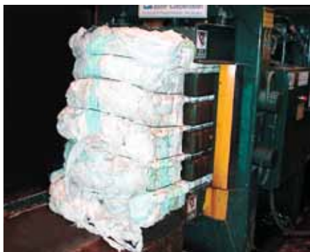
Pressun til útflutnings.

Tíðni safnana er oft ákveðin í samvinnu við sveitarfélögin og verður áhersla lögð á góða þjónustu.