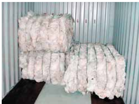
Hleðsla í gáma til útflutnings.